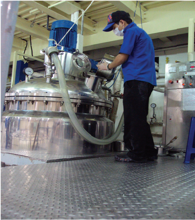
Photo 3 : Vue des malaxeurs-chauffeurs dans une usine de cosmétique basée aux EAU. L'installation est comparable à ce que l'on trouve dans les établissements basés en Europe.

L'usine que je dirige a la réputation de bien traiter ses « workers ». Des auditeurs envoyés par de grandes entreprises internationales clientes comme Disneyland ou Casino n'ont émis aucune critique sur les conditions de travail, les rémunérations ou les conditions d'hébergement. En tant que directrice de l'usine, il est rare que je doive intervenir directement pour régler des problèmes concernant les « workers ». J'ai été confrontée une fois à un accident du travail. Une ouvrière avait eu le doigt écrasé suite à la mauvaise utilisation d'une machine. Heureusement, on a pu finalement éviter l'amputation. J'ai découvert à cette occasion que les « workers » n'avaient aucune notion de secourisme et j'ai fait suivre aussitôt une formation de secouriste aux superviseurs. Une autre fois, on est venu me parler d'une querelle entre deux garçons en rivalité à propos d'une des employées. J'ai refusé de m'en mêler et j'ai seulement indiqué que toute querelle sur les lieux de travail serait suivie d'un licenciement immédiat. Je n'en ai plus entendu parler ensuite. Une autre fois encore,