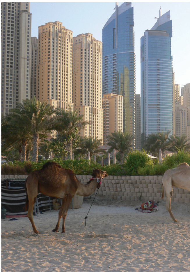
Photo 1 : Vue d'une plage de Dubaï où des chameaux promènent des enfants devant des immeubles modernes où logent les expatriés

Ce chapitre fait partie d'une série d'enquêtes conduites auprès de managers et ingénieurs français présents dans divers pays (Mexique, Brésil, Japon, Chine, Émirats Arabes Unis, Maroc, États Unis, Australie...) dans le but de repérer comment ils adaptent et modifient localement le management