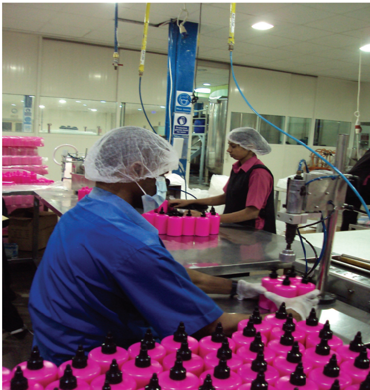
Photo 2 : Vue de l'atelier de conditionnement d'une usine de cosmétique basée aux EAU.

Où l'on voit comment se nouent les relations entre une jeune diplômée européenne, un patron libanais et des "workers" venus du Tibet, des Philippines ou du Sri Lanka.